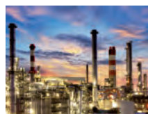
Petroindustrie Petrochemical industry