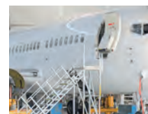
Luftfahrtindustrie Aviation industry