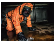
Tankreinigung Tank cleaning