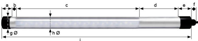
Abmessungen in mm | Dimensions in mm