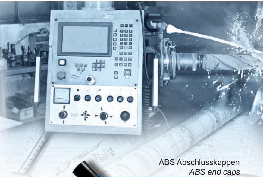
ABS Abschlusskappen ABS end caps

The modular design enables a consistent design that can be flexibly integrated into various installation conditions. The machine lights in this series offer different variants with 6, 12, or 18 POWER LEDs, allowing for different light lengths to be realized within the same lighting design.