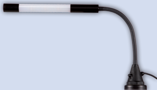
mit Magnet with magnet avec aimant met magneet