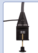
Schraubklemme screw clamp pince à visser schroefklem