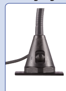
Anschraubplatte mounting plate plaque à visser aanschroefplaat