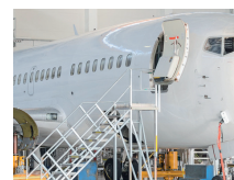
Luftfahrtindustrie Aviation industry