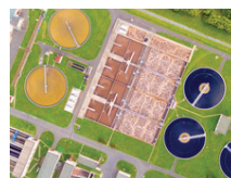
Kläranlagen Sewage treatment