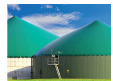
Biogasanlagen Bio gas plants

KIRA Leuchten GmbH Wiedenstr. 6, 78244 Gottmadingen