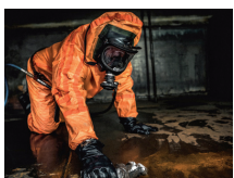
Tankreinigung Tank cleaning