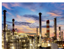
Petroindustrie Petrochemical industry