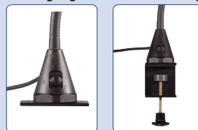
Anschraubplatte mounting plate plaque à visser aanschroefplaat Schraubklemme screw clamp pince à visser schroefklem