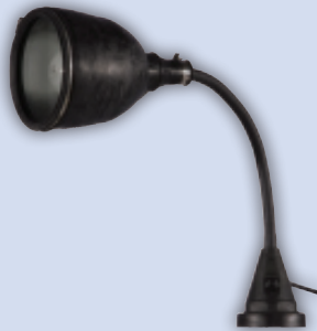
mit Magnet with magnet avec aimant met magneet

optional / optional / optionnel / optioneel